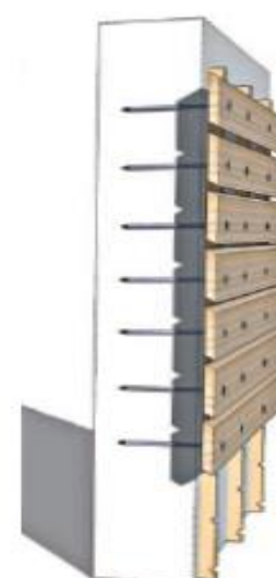
LE BARDAGE À CLAIRE VOIE

Ventilation naturelle par interruption des tasseaux